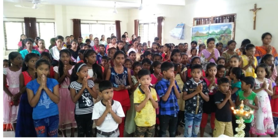
Celebració del dia de la dona