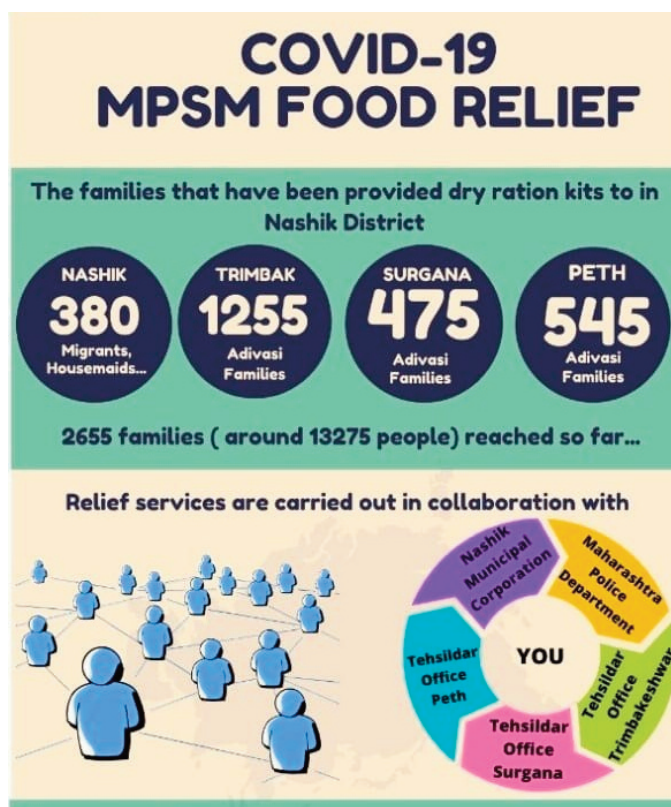
Accions realitzades pel MPSM

Per aquests motius des de múltiples i diverses organitzacions voluntàries (i també a títol individual) s'han realitzat nombroses accions, com el lliurament de bosses d'aliments, la facilitació de les targes de ra-