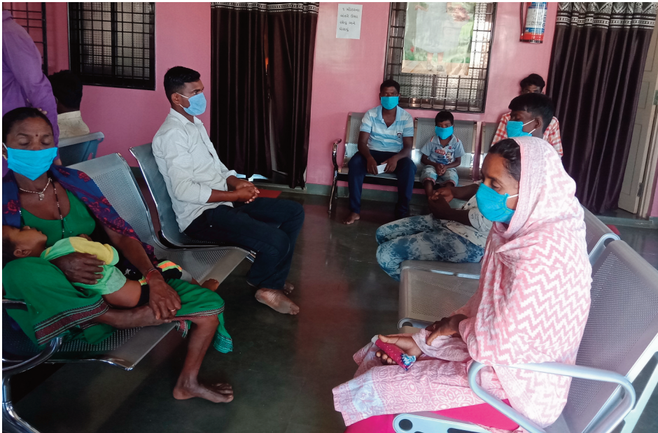
Hospital de Subir al Gujarat

l'orina de vaca és la millor cura pel Coronavirus? Què hi ha de dolent en la festa per veure orina de vaca que varen organitzar grups diversos a l'Índia? És més foll que el mon tancant-se portes endins davant d'un virus invisible? Tot depèn, de la lògica predominant. Com pot ser que un virus ridícul aturi el món del seu gir?