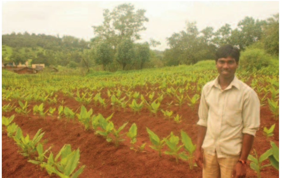
Plantación de un Self Help group

Es frecuente que pidan préstamos para bodas, problemas de salud, celebraciones, etc... a los prestamistas locales. Y para devolverlos, van a trabajar a las fábricas de los prestamistas, en la producción de ladrillos, la construcción de casas baratas, etc... sin embargo, como son analfa-