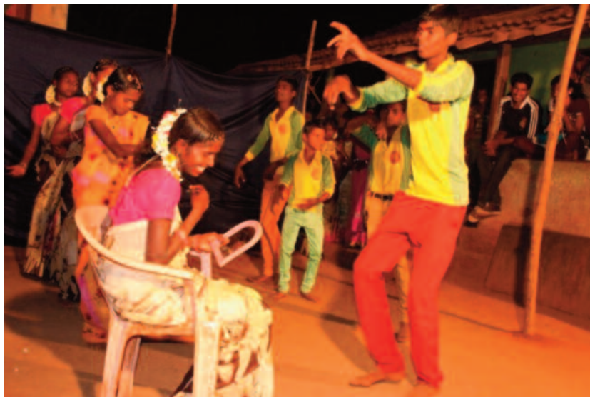
Fiesta de celebración de un matrimonio infantil

los ingresos familiares. Los miembros de los SHG se interesan en la compra de 1-2 cabras (el SHG aportará el 50% del coste total), éstas están aseguradas por el mismo SHG, ya sea por pérdida o muerte, y cada individuo se responsabiliza de su cuidado. En un plazo de 3-4 años cada cabra habrá tenido una camada de 6-7 cabras, y sus ingresos se habrán multipli-