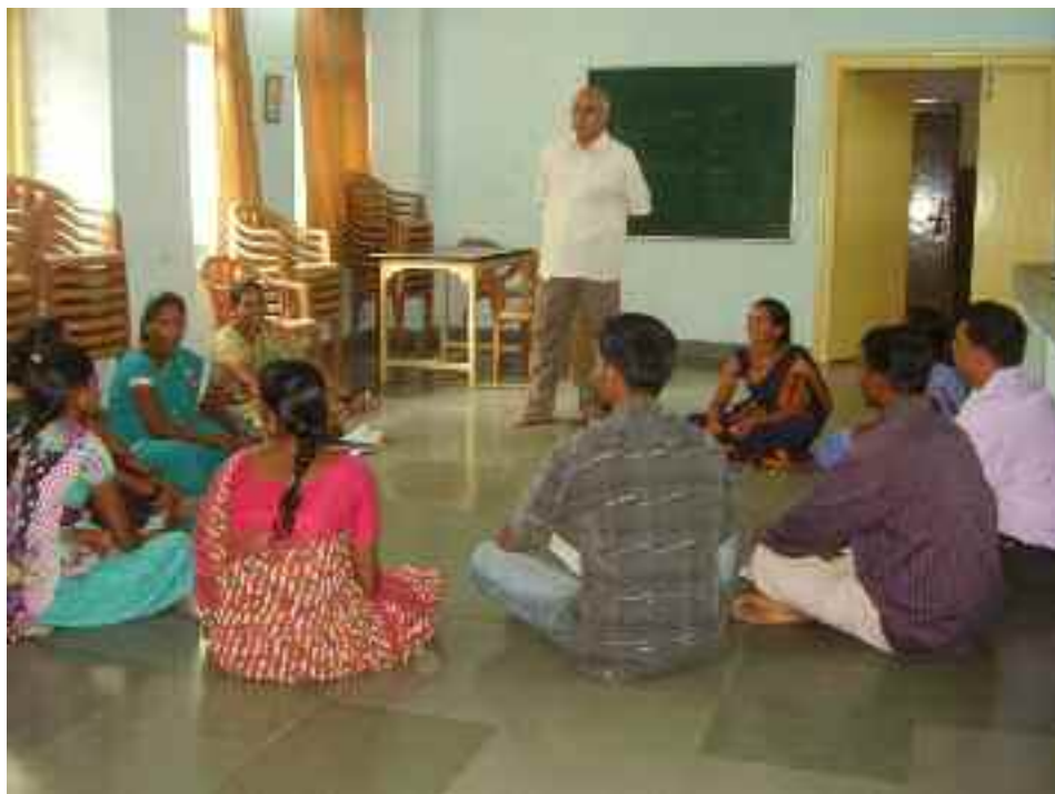
Taller de formació dels animadors i animadores

E n aquesta edició del Butlletí ens apropem al Projecte de Salut de l'ONG Premdaan Convent , que es va iniciar el mes de gener de 2014 i amb una duració de 3 anys. Es desenvolupa en el districte de Thane, Maharashtra, i més concretament a Nagzari-Dongripada i a Ashgad, poblacions tribals warlis. L'objectiu d'aquest projecte és la recuperació de les condicions de salut als esmentats poblats, i principalment la reducció de la mortalitat maternoinfantil i la sensibilització i prevenció de la SIDA, així com d'altres malalties transmissibles.