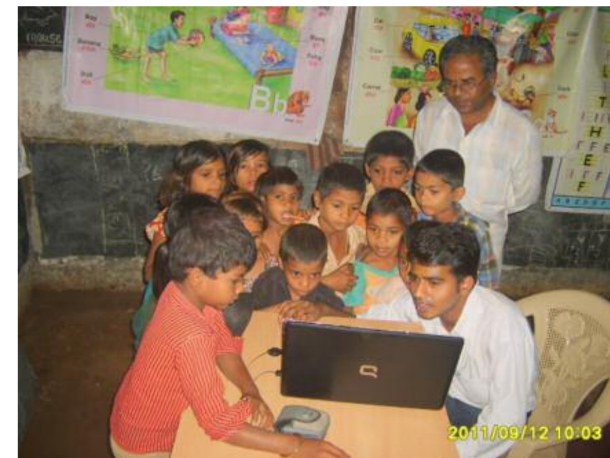
Seminario practicando ejercicios en el PC

A lo largo de los años MPSM ha desarrollado un material teórico, pero ahora se centrará en el diseño de material de lectura en forma de pequeños cuadernos que contengan información relevante y que sea explicada de forma original.