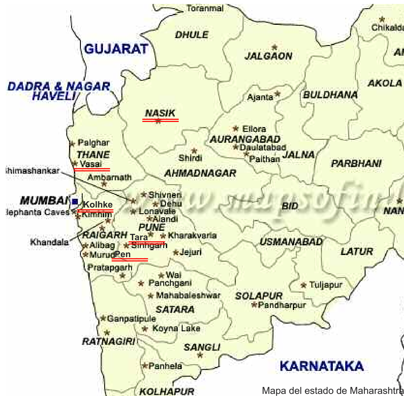
Mapa del estado de Maharashtra

1. Promocionar la comunidad local con la información y los conocimientos necesarios para hacer mejor uso de estos recursos.