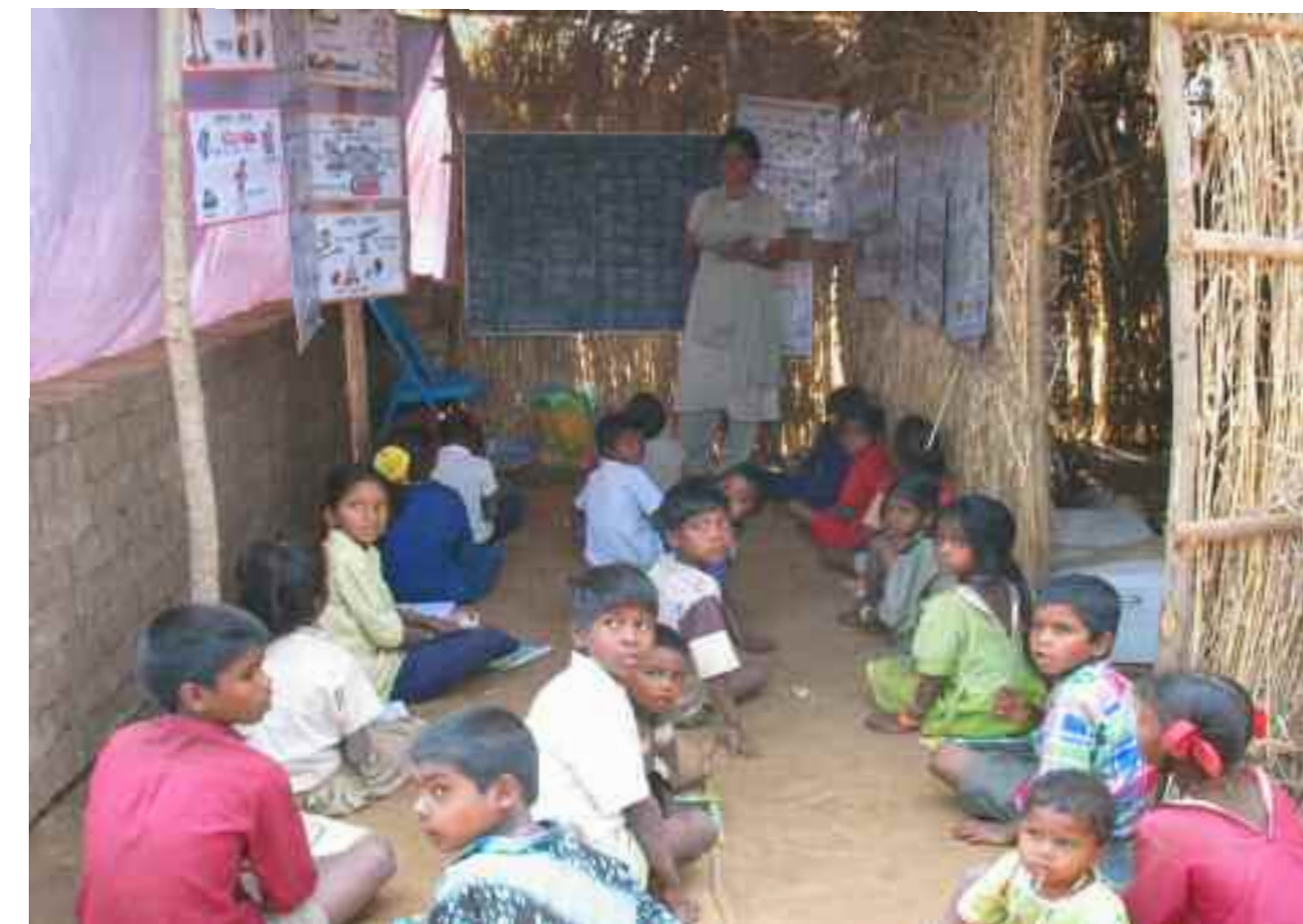
Bonga-Shala o escuela cabaña

- Promoción de la medicina tradicional - La educación de los niños a través de la escuela y otras actividades.