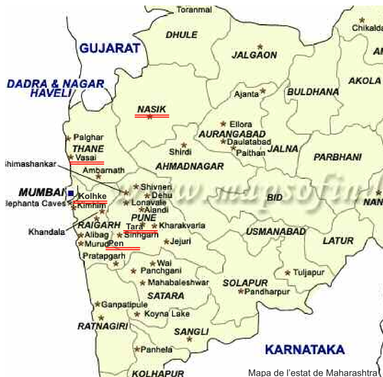
Mapa de l'estat de Maharashtra