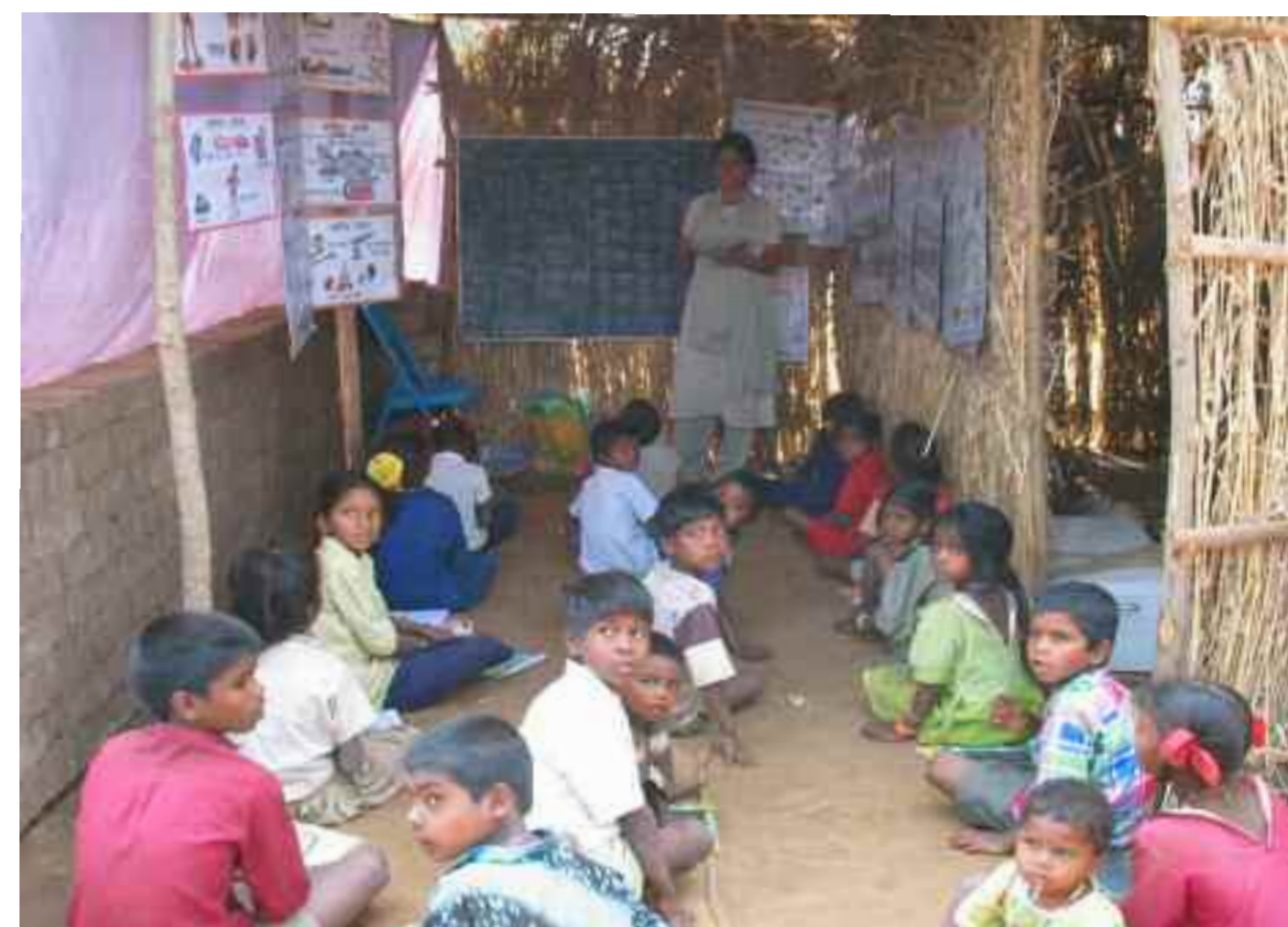
Bonga-Shala o escola cabana

Altres objectius més concrets serien: - La creació d'oportunitats per a la subsistència. - L'augment de l'autorealització a tots nivells. - La promoció de la medicina tradicional. - L'educació dels infants de les tribus a través de l'escola i altres activitats - La capacitació de la comunitat per a la defensa dels seus drets i per relacionar-se amb l'Administració.