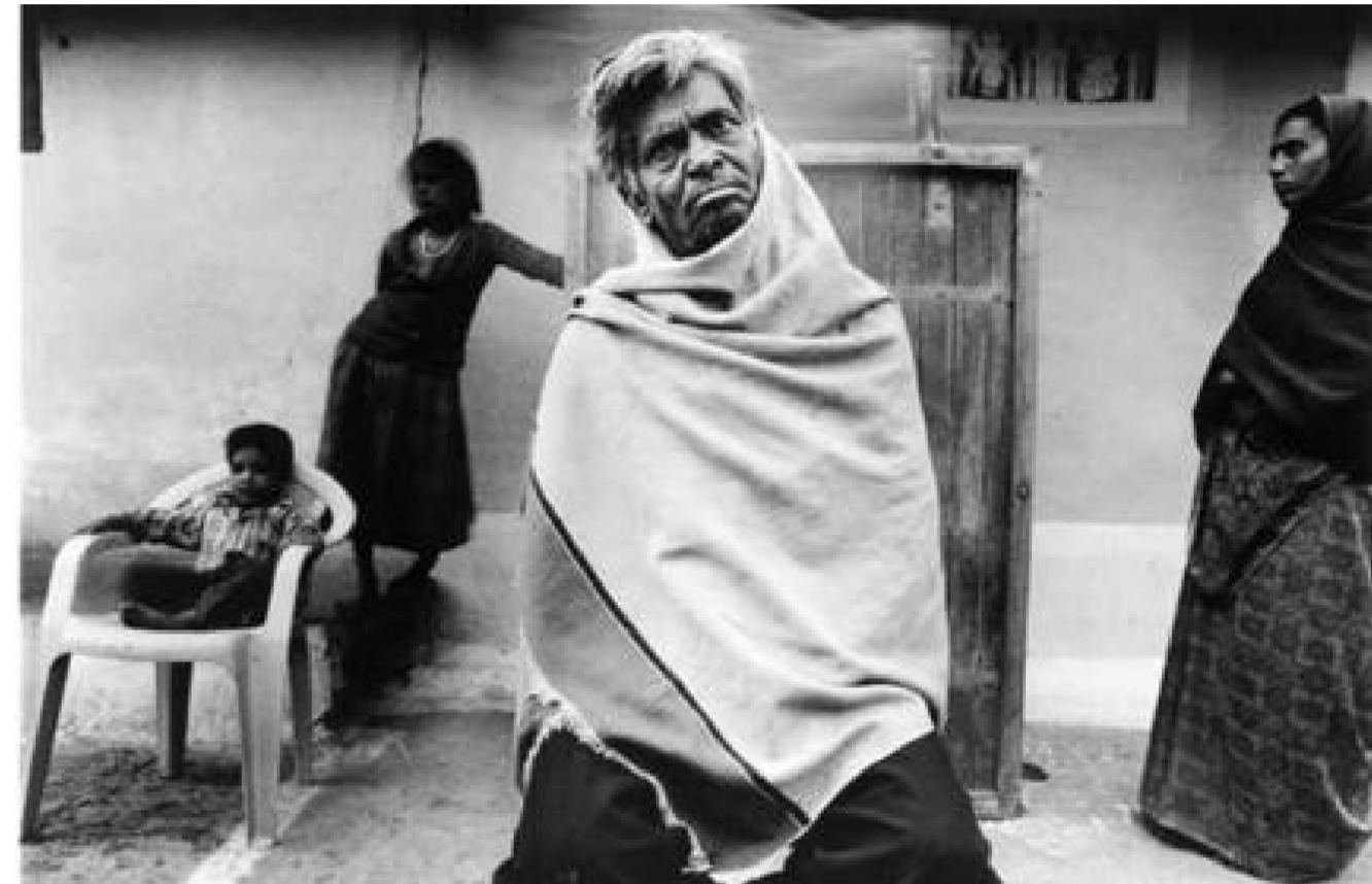
fotografia de Raghu Rai

A nivell ecològic, el 1999 Greenpeace amb l'informe " El llegat de Bhopal " denunciava ja la presència de tòxics com el níquel, el plom, el mercuri, els hexaclorohexans (HCH) o bé els compostos orgànics volàtils (VOC's) en el sòl i en els aqüífers.