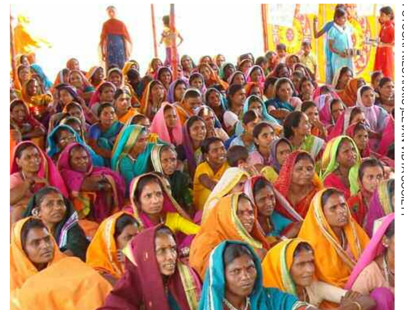
Dones a la Mahila Melawa

Què heu après a la Jeevan al llarg d'aquests anys de treball amb els Adivasis? Al principi de treballar amb les