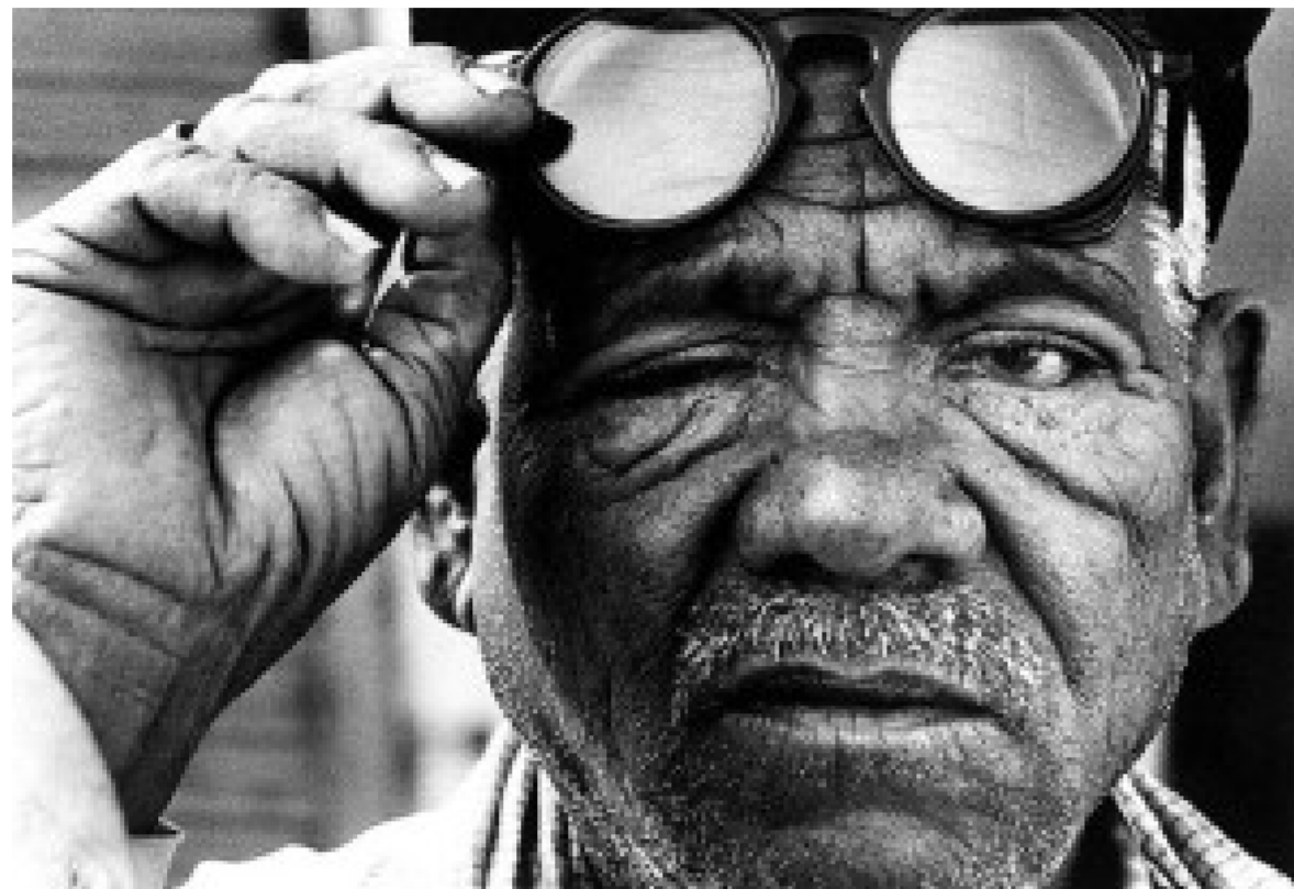
fotografia de Raghu Rai

Fragment Era Mitjanit a Bhopal . Novela d'investigació-ficció de Dominique Lapierre i Javier Moro