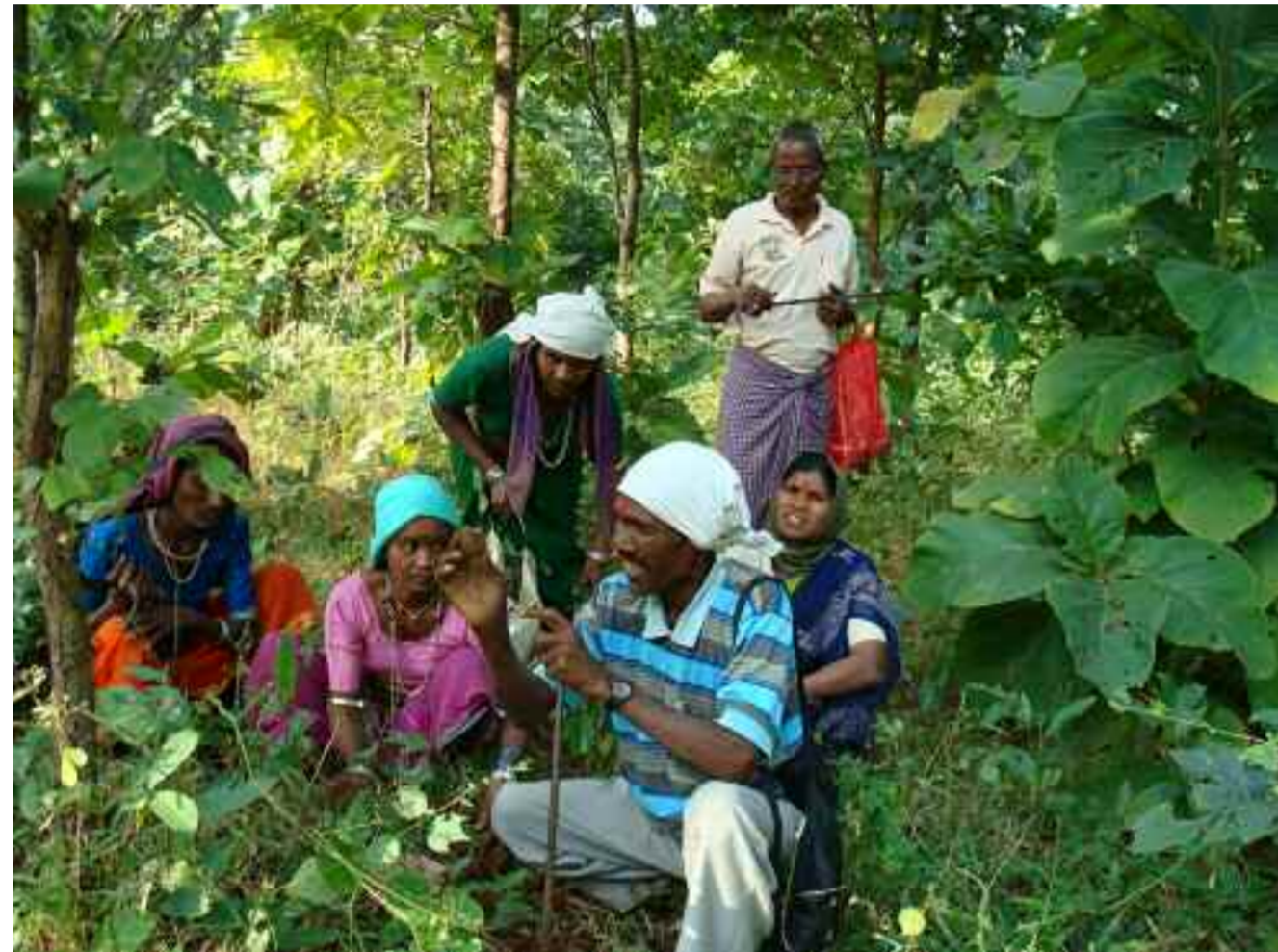
Dones adivasis a una excursió al bosc sobre fitoteràpia