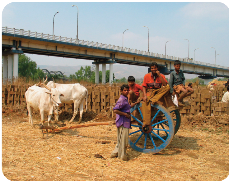
Joves descansant a les bòviles

Aquestes consideracions no ens han d'enganyar i cal que tinguem present que les dones tribals fan tot el treball domèstic, que inclou recollir llenya, herba i aliments del bosc pel consum de la família i del seu bestiar, anar a buscar aigua, etc. Fet que contribueix a una taxa d'a-