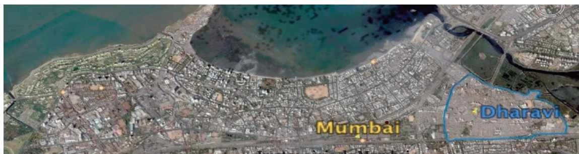
Imatge aèria de Mumbai

El model d'explotació dels recursos naturals en pro del creixement econòmic NO s'ha aturat des d'aleshores, ans el contrari. L'última dècada del segle XX va produir més refugiats ecològics (la majoria poblacions pobres rurals i tribals) que els anys que la