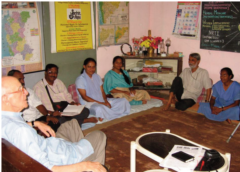
Membres de les diferents ONG's amb qui ADA col·labora.

Evidentment, i com no podia ser d'una altra manera, la reunió va acabar amb un bon àpat on no hi va faltar, l'arròs, el dhal i uns plàtans ben dolços.